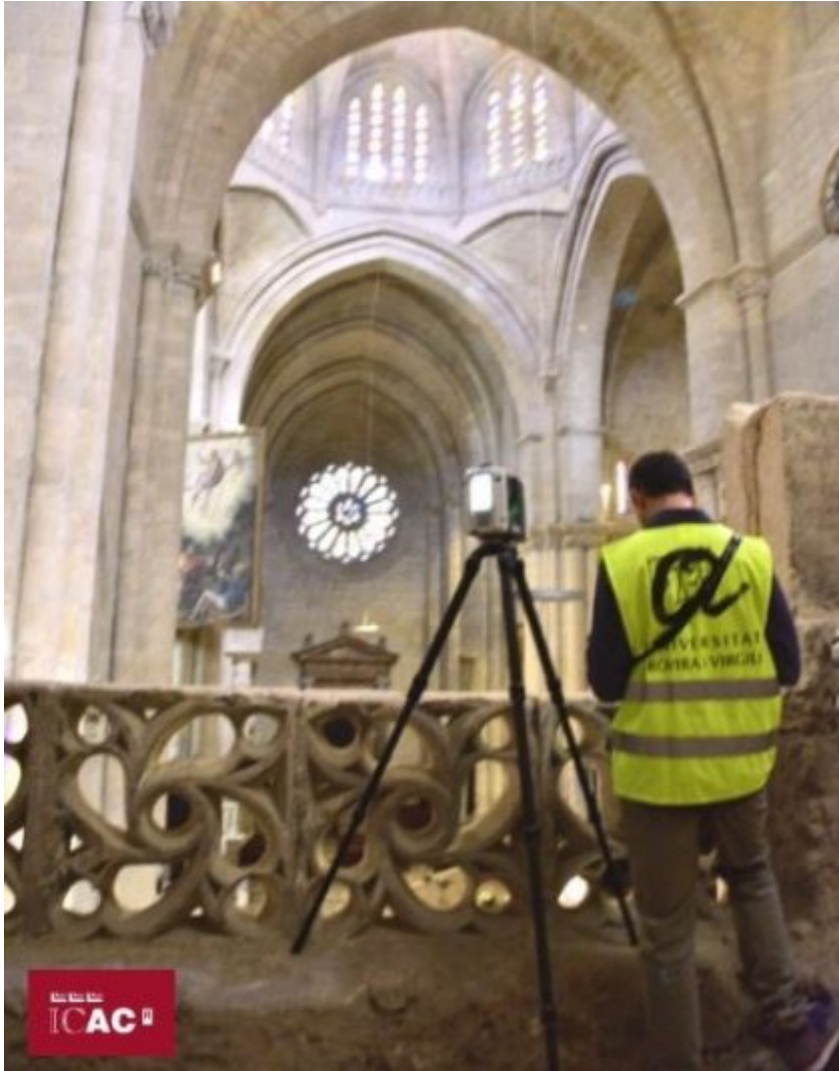
catedral maig 2024 (2) - 1