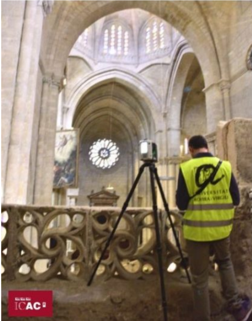
catedral maig 2024 (2) - 1