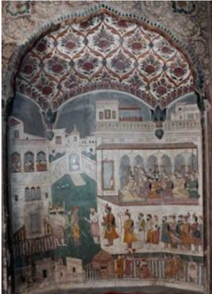
Fig. 12 Parashurama Confronts Rama, episode from the Ramayana, detail from a mural in the Burj temple, Jammu, c. mid-19th century