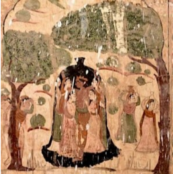
Fig.7 Krishna in an Amorous Union with Gopis, detail from a mural in the Sui Simbli temple, Jammu, c. mid-19th century

Con más de una decena de imágenes, como estas: