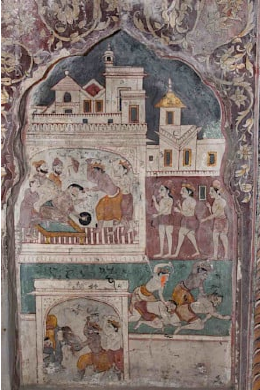
Fig. 13 Krishna slays the Demon-king Kamsa, episode from the Bhagavata Purana, detail from a mural in the Burj temple, Jammu, c. mid-19th century

in the Sui Simbli temple, Jammu, c. mid-19th century