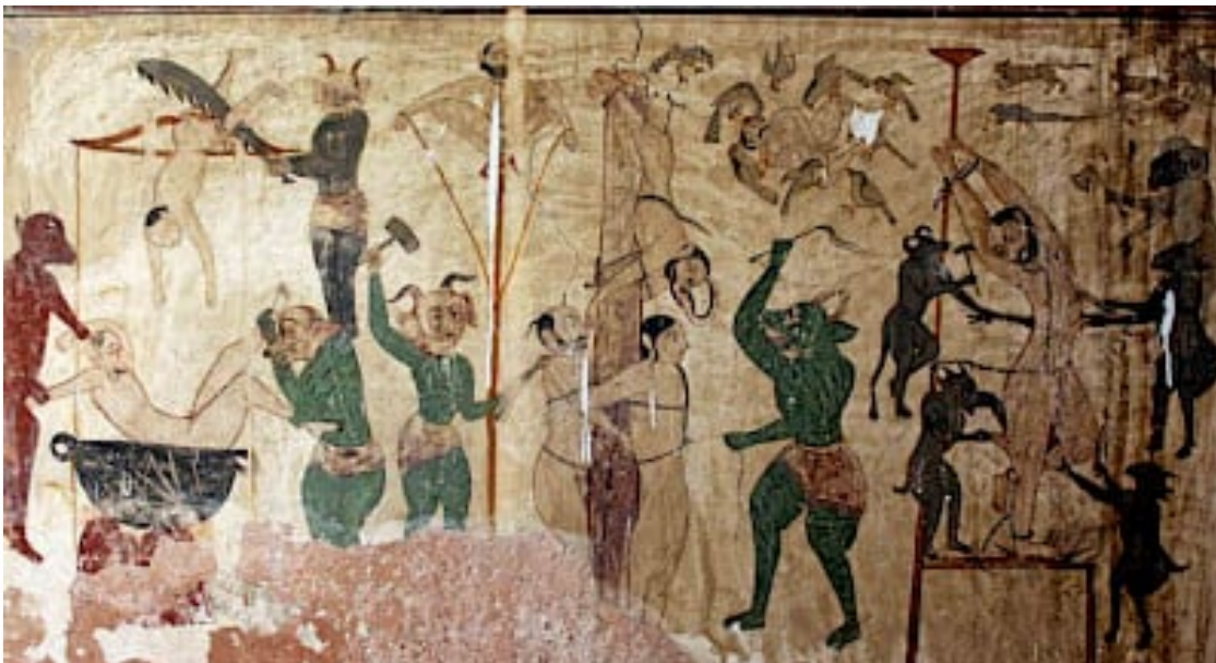
Fig. 4 Scene of Hell, detail from a mural in the Sui Simbli temple, Jammu, c. mid-19th century