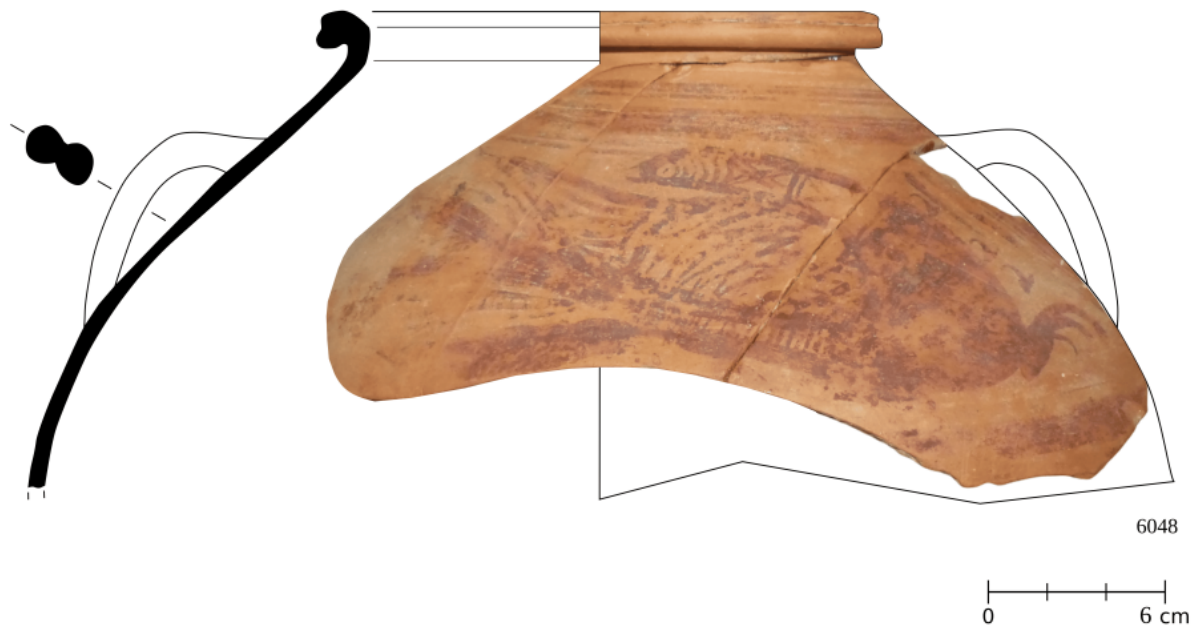
Figura 18. 6048: vasija de tinaja de cuerpo ovoide con asas verticales geminadas, decorada con figura de ave con las alas explayadas y la cabeza girada.