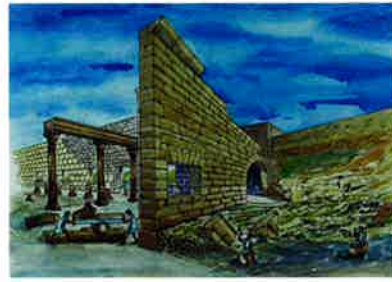
S. VI ANNO DOMINI