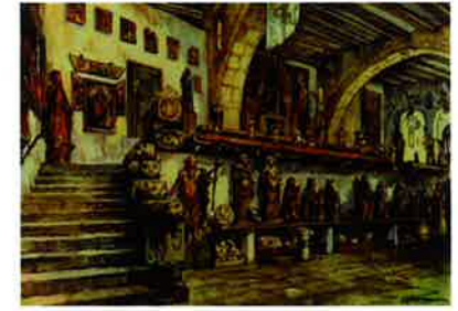
S. XX ANNO DOMINI