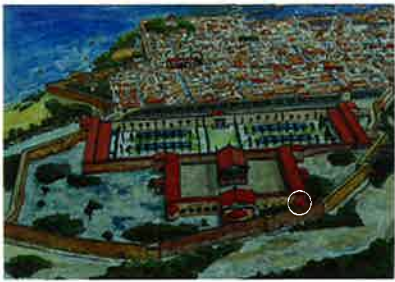
S. I ANNO DOMINI