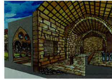
S. XIII ANNO DOMINI