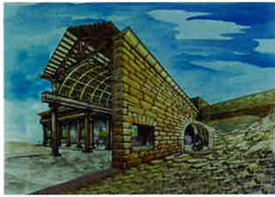
S. I ANNO DOMINI