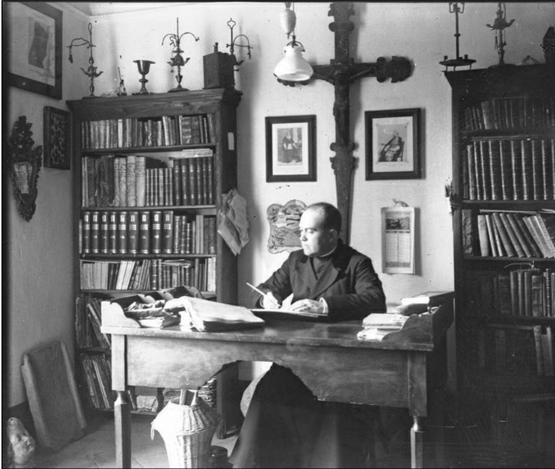
Mn. Serra i Vilaró treballant

El 1940 és nomenat canonge de la Catedral de Tarragona. Durant els anys següents continua amb la publicació de les seves recerques i rep diferents distincions cíviques i acadèmiques. Mor a Tarragona el 27 d'octubre de 1969 i és enterrat a la Necròpolis Paleocristiana de Tarragona.