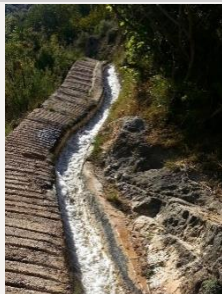
Acequia, Los Millares (Almería)