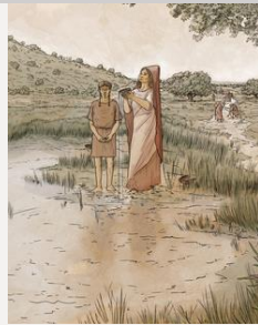
Santuario de Haza del Rayo, (detalle)