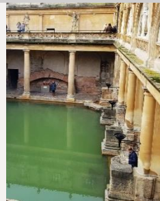
Termas romanas de Bath, Inglaterra