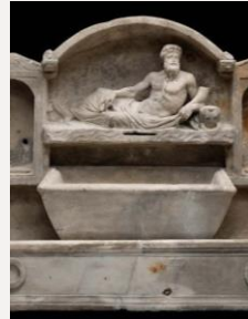
Fuente con imagen de río Museo de Bellas Artes, Boston