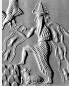
Sello, Mesopotamia Museo Británico, Londres