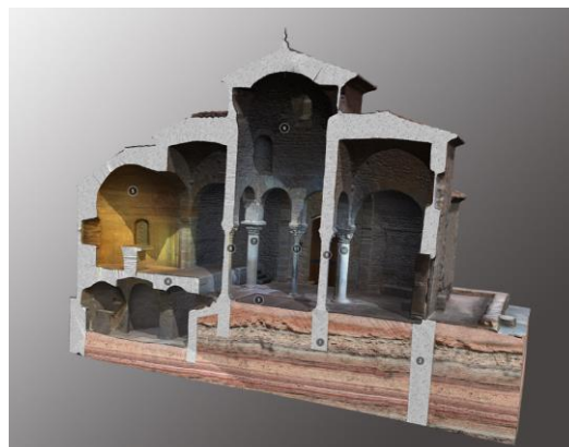
Visualització infogràfica de l'església funerària de Sant Miquel de Terrassa.