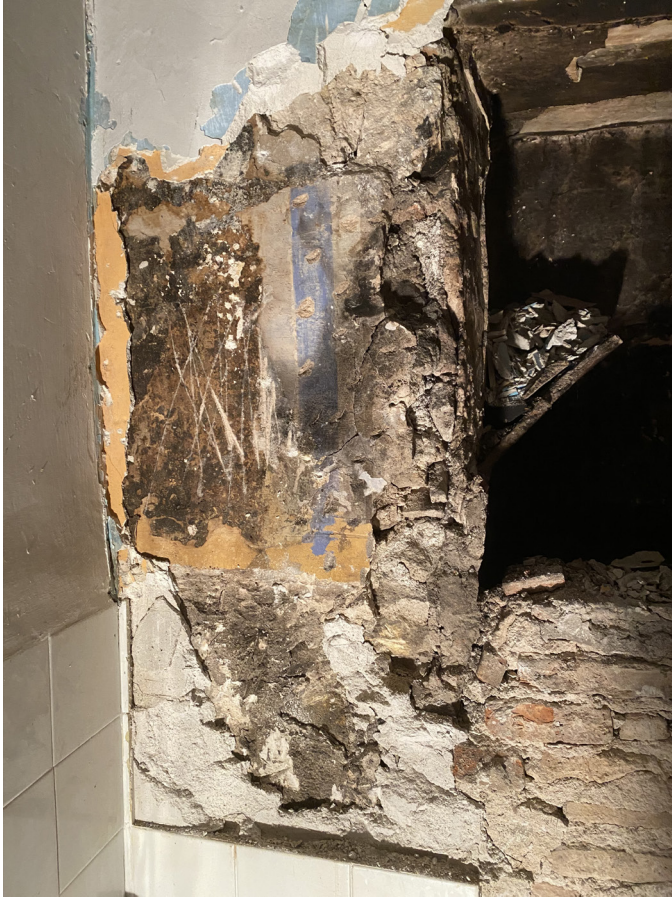
Figura 1. Exemple de sondeig vertical. Capa amb decoració pictòrica

I què passa quan ampliem encara més el focus? Si s'aborda l'estudi d'un context urbà, en el marc d'un projecte arqueològic o de varies actuacions successives, ens trobem amb una gran quantitat d'informació de tipus arquitectònic sovint desconnectada l'una de l'altra. Aquest procediment acaba creant una xarxa de parcel·les descobertes, enmig de les que no s'han obert encara, algunes de les quals tenen restes arqueològiques i d'altres no, quasi com el tauler del popular joc Pescamines. A més, malgrat algunes excepcions, aquesta informació no es posa en comú en un sol suport. Aquest panorama implica una gran dificultat a l'hora de fer síntesis interpretatives, ja que cal fer una feina prèvia de recerca de la informació de diferents intervencions, posar en comú les dades topogràfiques, etc.