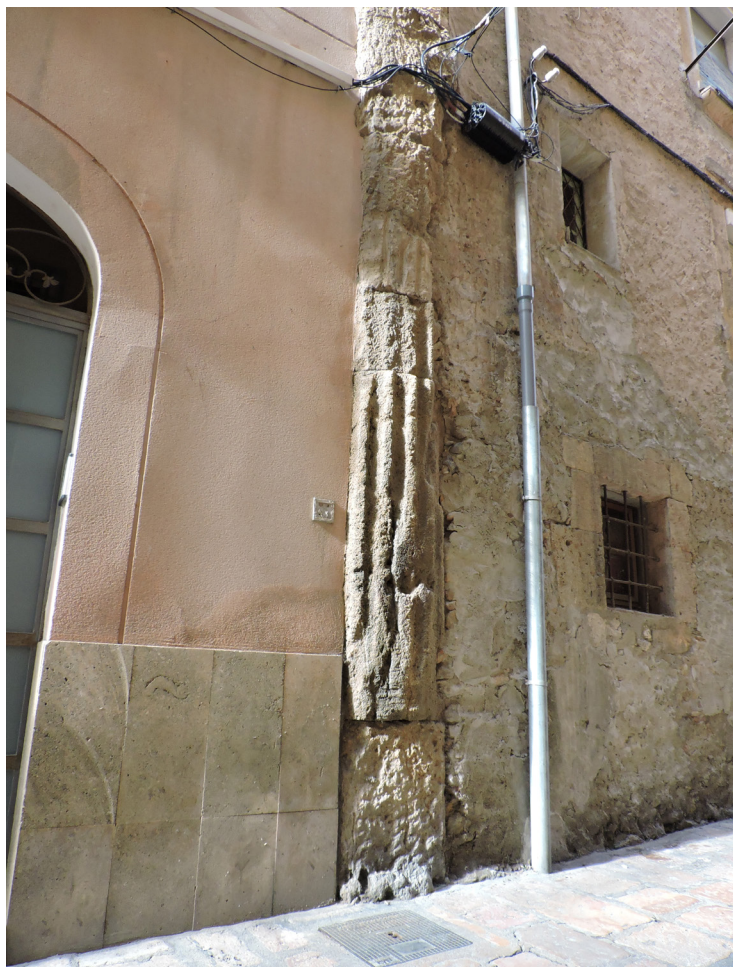
Figura 2. Columna romana inserida en una de les façanes del carrer Granada de Tarragona