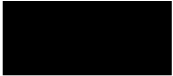
Vicerector/a de Personal docent i investigador