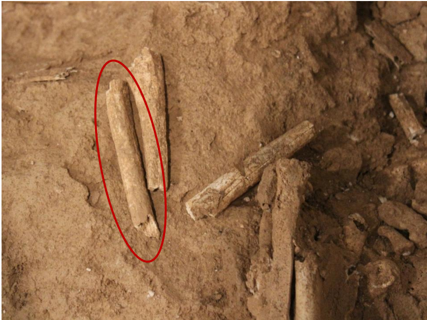
Fragment de costella