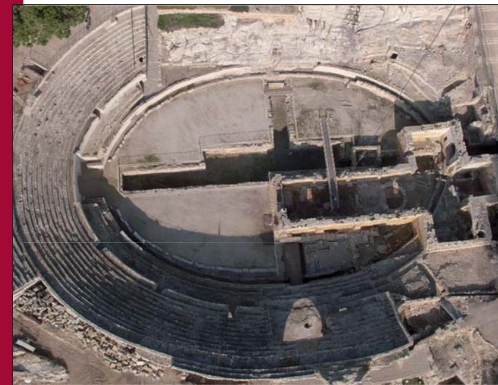
Vista aèria amfiteatre

Institut Català d'Arqueologia Clàssica Institut Superior de Ciències Religioses Sant Fructuós Museu Bíblic Tarraconense