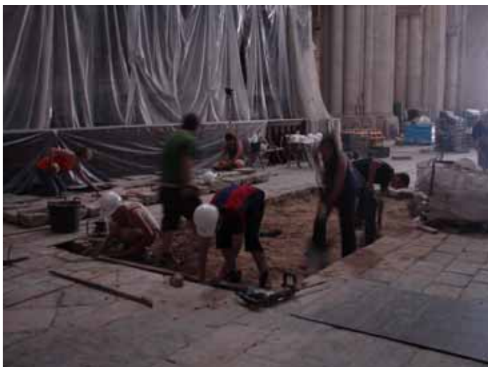
Primeres tasques del sondeig a la nau central.