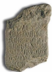
CE 1014, 1062 (Tarraco).